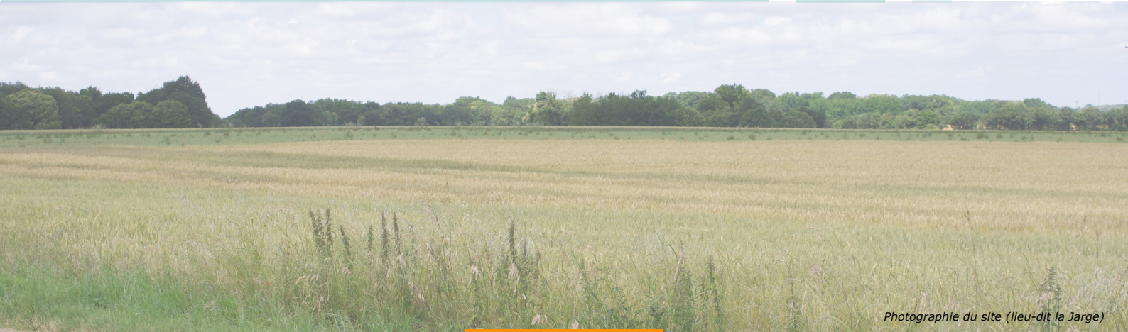
Photographie du site (lieu-dit la Jarge)

Bien que la France mise en partie sur le nucléaire pour assurer son indépendance énergétique, il ne suffira pas et les futurs réacteurs ne seront pas fonctionnels avant au moins 2035, selon le rapport de RTE. L'éolien, comme les autres énergies renouvelables, apporte une réponse rapide à la demande d'électricité décarbonnée et respectueuse de l'environnement.